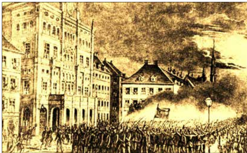
Узрујана светина у Сегедину

29. септембра 1854 – У Ваљевоу је умро прота Матеја Ненадовић, војвода и један од вођа Првог српског устанка. Био је први дипломата обновљене Србије и творац и први председник Правитељствујушег совјета. Његови „Мемоари“ драгоцено су сведочанство о људима и догађајима из тог времена. У ослобођеној Србији био је обор-кнез Ваљевске нахије и заседао је у Народној канцеларији у Београду. Али како му са кнезом није увек ишло лако, у неколико наврата је падао у немилост, па је онда опет позиван. Оптужен је 1817. за заверу против кнеза Милоша и смењен са кнежевске дужности, али је на њу враћен већ идуће године. У периоду 1821-24. живео је повучено у Бранковину, уз ограничење да се не меша у политику. Затим је у новембру 1827. почео да ради на администрацији Посавске кнежевине, па се поново повукао децембра 1831. године.