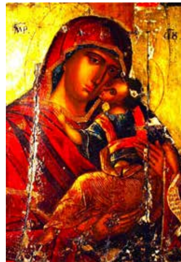
Богородичина икона у манастиру Ходош