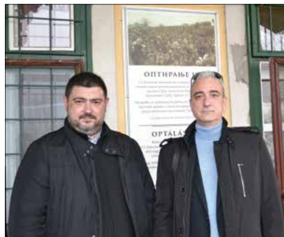
Потомци батањских оптаната

Наравно, и предходна, а и ова књига имале су своје представљање у Матици српској, у Новом Саду, Беоцину, Војвода Степи, Зрењанину, на местима по којима су Батањци гравитирали. Књига је свугде примана на најлепши могући начин. Потомци оптаната имају ту фину емоцију која их везује за њихове претке. Претке који су један свет радан, миран, свет који сабира друге људе око себе. Мени је јако било интересантно да истражујем како то оптанци преносе своја искуства рада у равници добровољцима, Солунцима који су дошли из динарских крајева Југославије, на један добромеран и племенит начин. То посебно важи за Батањце. Ја сам одрастао у Војвода Степи, где је био батањски крај, батањски бунар и знам те породице, које су својом мирноћом, вредноћом, радиношћу, организовањем и прецизношћу оплеменили средину у којој су живели.