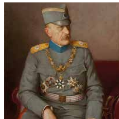
Војвода Живојин Мишић, командант Колубарске битке

16. новембра 1918 – После пропасти Аустроугарске монархије у Првом светском рату, Мађарска је проглашена независном републиком.