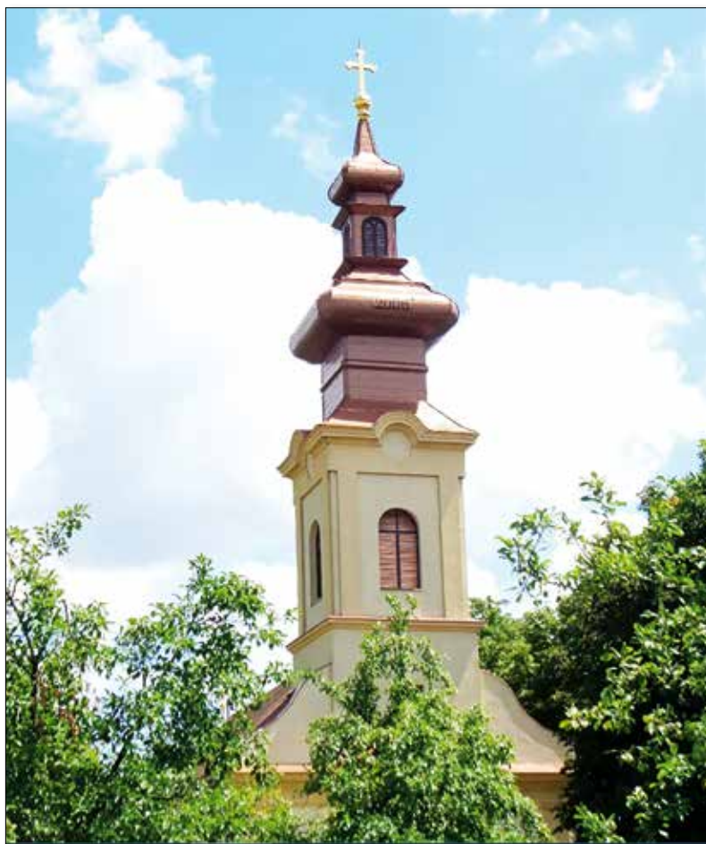
Звоник дешчанске српске цркве

у том часу, онако, сас уздигнутим рогољама у рукама, облило неко до тада сасвим непознато чувство. Није то био само осећај раздражљивости и беса. Ајак! У мени се, оче, тад појавио осећај забрањеног ужитка. Наслађив’о сам се сас страхом тог згрчитог Маџара. У устима сам осећао сладак укус гордости и надмоћи. Ужив’о сам