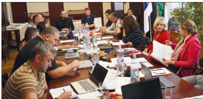
Детаљ са једног од прошлих заседања Скупштине ССМ