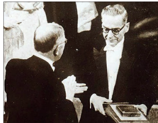
Нобеловац Иво Андрић рођен је 9. октобра 1892.

10. октобар 2005 – У Београду је проглашен почетак преговора о Споразуму о стабилизацији и придруживању Србије и Црне Горе Европској Унији.