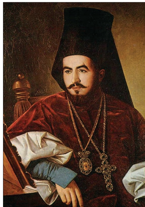
Петар Петровић Његош, умро је 31. октобра 1851.

31. октобра 1984 – Испред резиденције у Њу Делхију убијена је Индира Ганди, премијерка Индије. Убиство су извршили Сики екстремисти, припадници њеног личног обезбеђења.