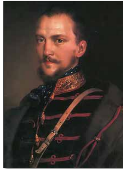
Генерал Артур Гергеи