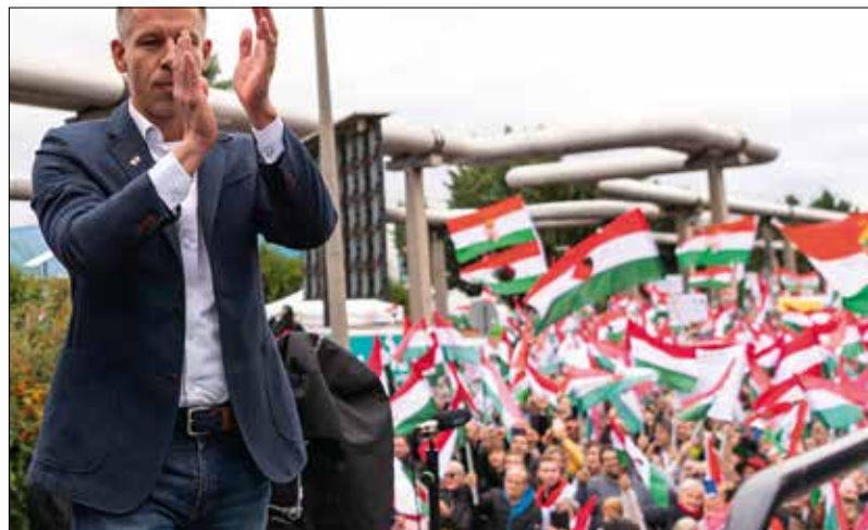
Петер Мађар Тиса партија