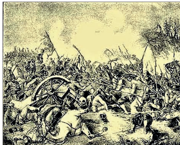
Савремени приказ борбе код Србобрана

16. августа 1717 – У бици код Београда у аустријско-турском рату, у којој се на страни Аустријанаца борило и 6000 Срба из Војводине, принц Еуген Савојски потукао је турску војску и заузео Београд. Пожаревачким миром, који је уследио 1718. Аустрији је припала северна Србија, Банат и северна Босна.