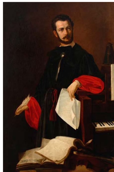
Композитор, пијаниста и хоровођа Корнелије Станковић рођен је 18. августа 1831. у Будиму

21. августа 1898 – Рођен је књижевник Душан Матић један од најзначајнијих српских надреалистичких песника.