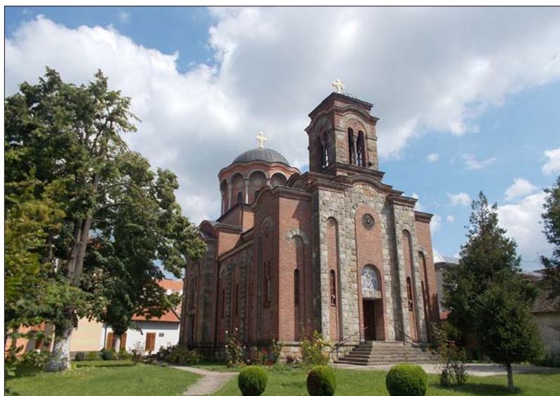
Српска православна црква Успења Пресвете Богородице у Осјеку

Хрватска и даље стално тражи да се врате културна добра која су за време рата пренесена у Србију. Нико не спори да те драгоцености треба да се врате, али када се врате и Срби, и када се нормализују услови за њихов живот, када се обнове порушене цркве и када се трајно обезбеди српско црквено благо од пропадања, пљачке и девастације. Већи део блага који Хрватска сада потражује од Србије имовина је Српске православне цркве. Реч је о 1065 културних добара из 45 православних цркава, манастира и ризница са подручја Далматинске, Осјечко-пољске и Барањске епархије. Ти предмети нису, како често истичу хрватски политичари, ни отуђени, ни украдени, већ су током рата склоњени на сигурно како би избегли судбину блага које је систематски уништавано за време НДХ.