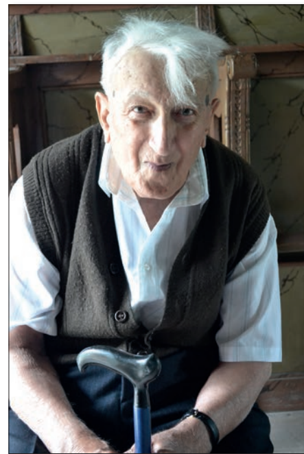
Нека му је лака црна земља и вјечнаја памјат.

Сахрањен је на сечујском српском православном гробљу, на узвишењу поред Дунава, које гледа управо на српску православну цркву посвећену Преносу моштију Св. оца Николаја у Бари, чији је чувар и старатељ био, и коју је увек волео, штитио и улепшавао.