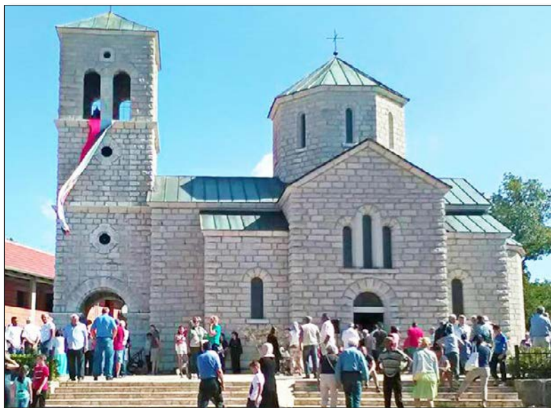
Манастир Свете Великомученице Недеље у Оџестову

Музејски саветник, генерални секретар Удружења Срба из Хрватске