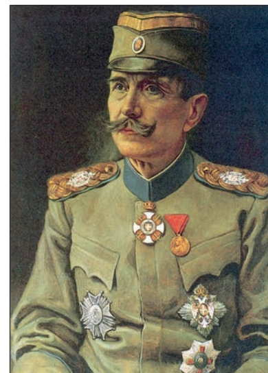
Војвода Петар Бојовић

9. новембра 1835 – Рођен је Даворин Јенко, један од најзначајнијих композитора романтичара у словеначкој и српској музици. Аутор је српске химне „Боже правде“ и словеначке „Напреј, застава славе“.