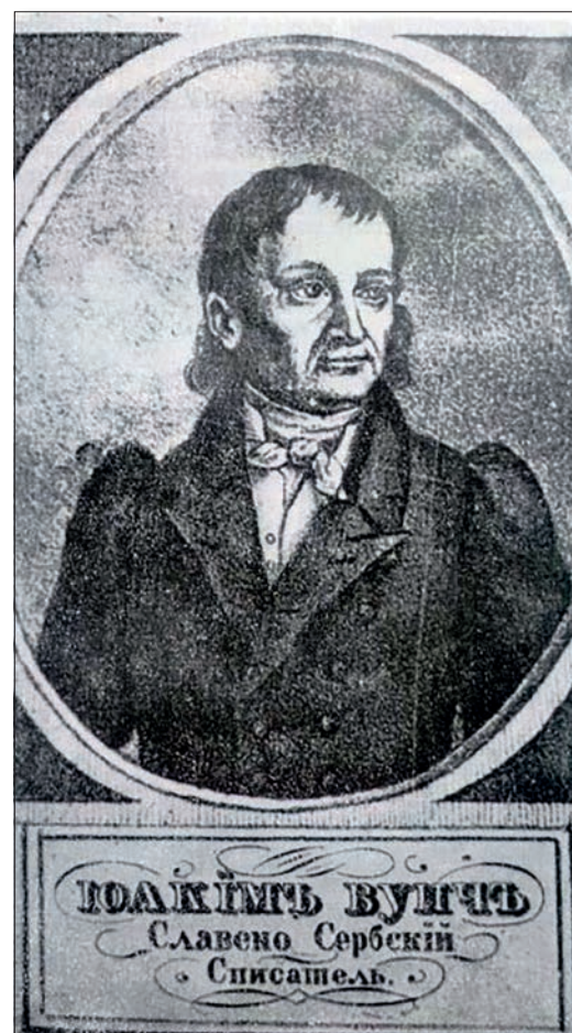
Јоаким Вујић, српски књижевник и позоришни писац рођен је 9. септембра 1772. године у Баји