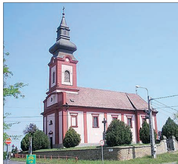
Српска црква у Сиригу

22. септембра 1882 – Умрла је српска сликарка Катарина Ивановић, прва жена члан Српског ученог друштва. Сликала је портрете, историјске жанр-композиције и врло успешне мртве природе. Неке њене слике су међу најбољима у српском класицизму, попут „Портрета кнегиње Персиде Карађорђевић“, „Аутопортрета“, „Корпе с грождјем“.